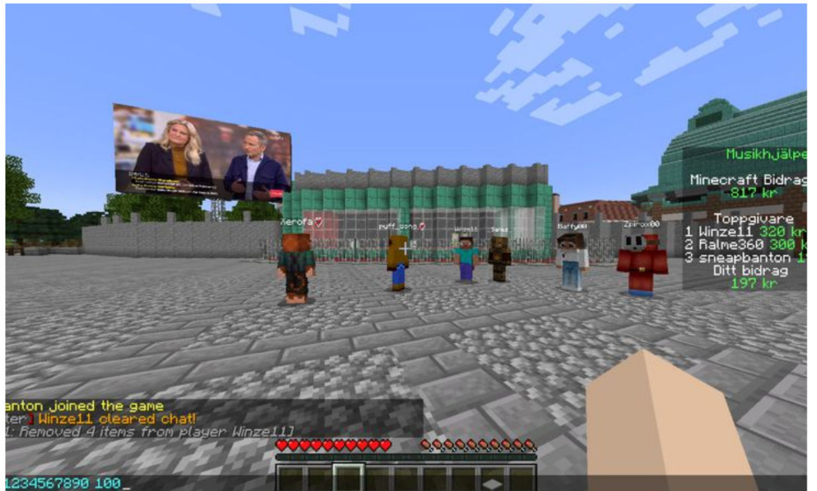
I Minecraft kan spelarna i år följa Musikhjälpen i realtid. Ljudet i miljön är spatialt, vilket innebär att man bara hör de som är närmast – precis som i verkligheten.